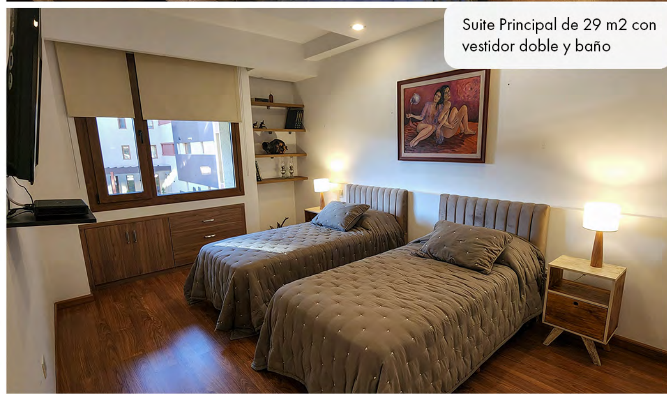
Suite Principal de 29 m2 con vestidor doble y baño