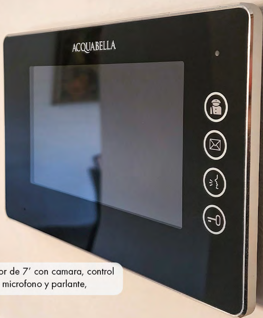
Portero-visor de 7' con cámara, control de acceso, microfono y parlante,