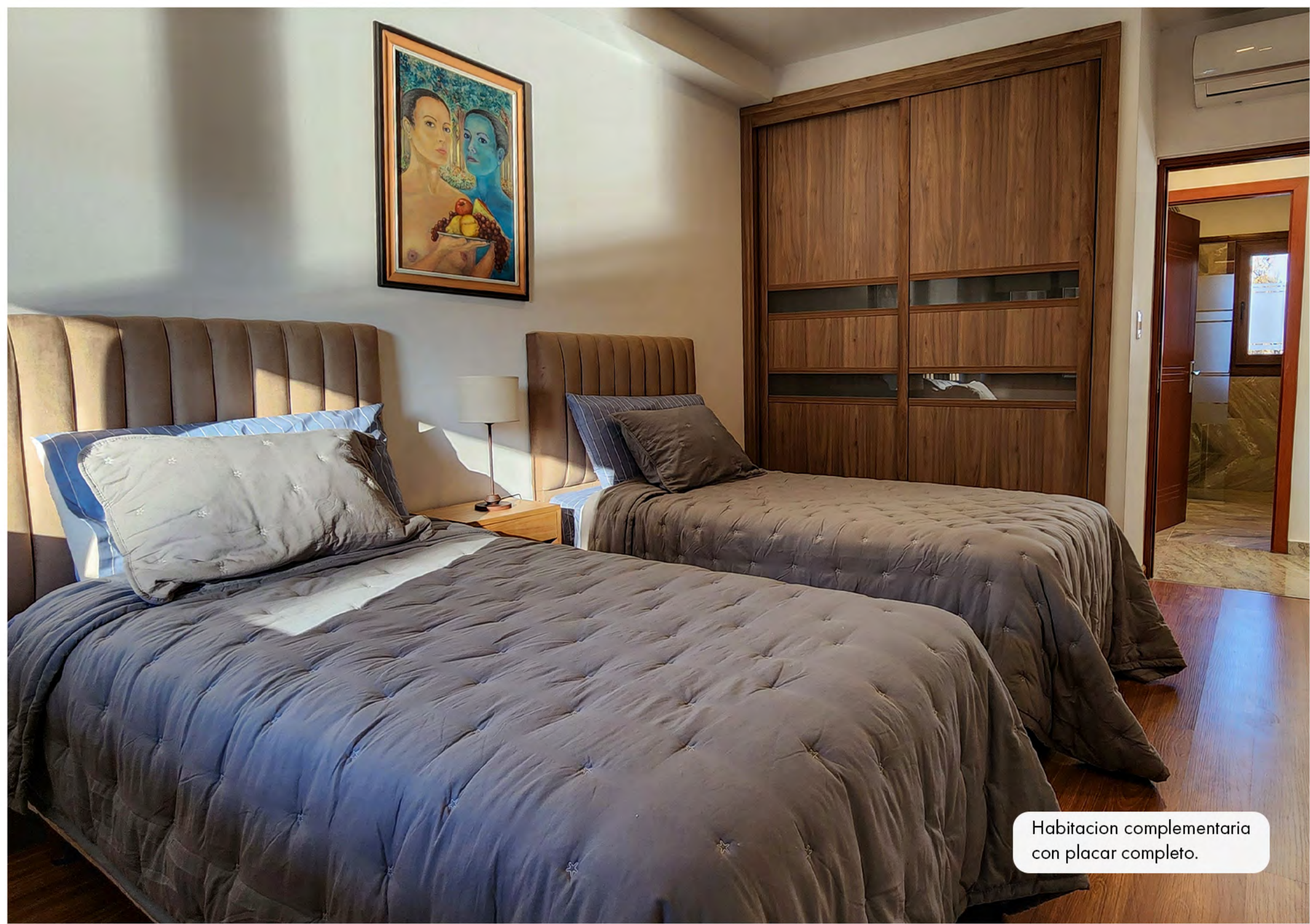
Habitacion complementaria con placar completo.