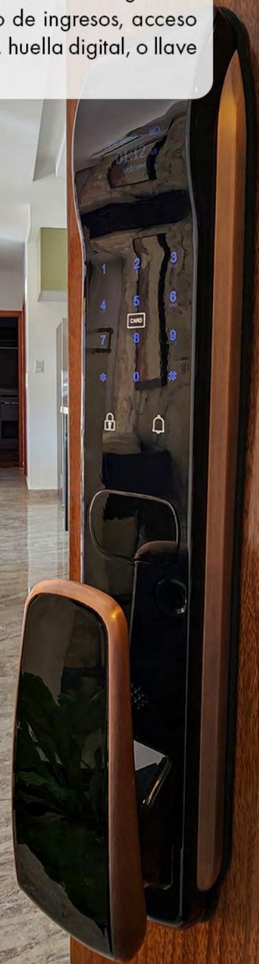
Cerradura biometrica de alta seguridad con timbre, registro de ingresos, acceso por código, tarjeta, huella digital, o llave mecanica