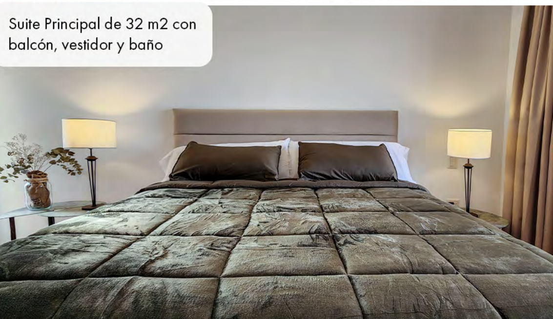
Suite Principal de 32 m2 con balcón, vestidor y baño